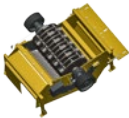
ROTORE CON MARTELLI ROTOR WITH HAMMERS